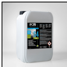
Illustration: contractuele foto