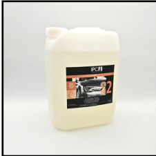
Illustration contractuelle photo