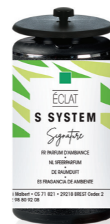
« S » SYSTEM Geurcartridge 25 mL Éclat