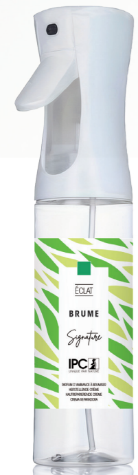
GEURMIST 270 mL Éclat

Assortiment « L » • « M » • « S » SYSTEM Geurverspreider