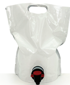
OPLADEN Éclat 1 L