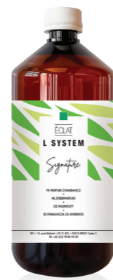
« L » SYSTEM Opladen 1 L Éclat