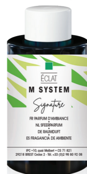
« M » SYSTEM Geurcartridge 100 mL Éclat