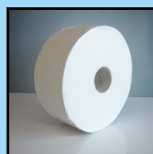
BIODOUX JUMBO 400 M PAPIER HYGIÉNIQUE EN ROULEAU GÉANT PRÉDÉCOUPÉ