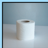
BIODOUX PH 200 FEUILLES PAPIER HYGIÉNIQUE EN ROULEAU