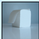
BIODOUX PH PAQUET 2 PLIS PAPIER HYGIÉNIQUE EN FEUILLE