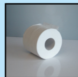
BIODOUX MAX 500 PAPIER HYGIÉNIQUE EN ROULEAU COMPACT