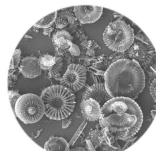
Terre de diatomée au microscope