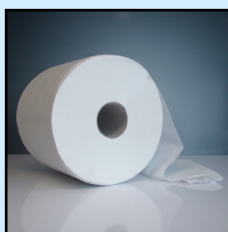
BIODOUX 1000 BOBINE