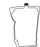
Poche 5 L