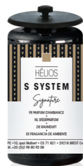
« S » SYSTEM Cartouches 25 mL ONE I et Hélios