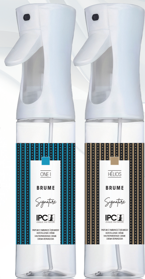
BRUME 270 mL ONE I et Hélios