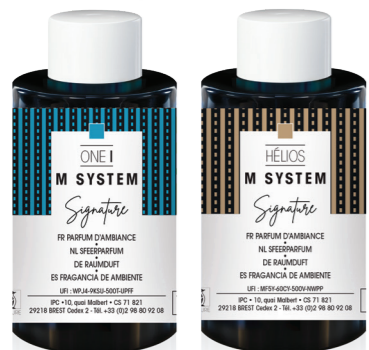
« M » SYSTEM Cartouches 100 mL ONE I et Hélios