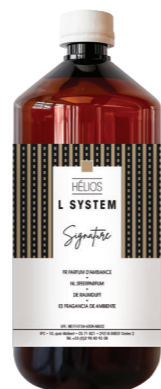
« L » SYSTEM recharges 1 L* ONE I et Hélios