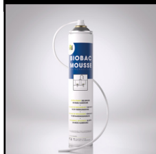
Foto de contractul