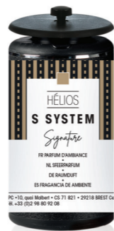
« S » SYSTEM Cartucho 25 mL ONE I y Hélios