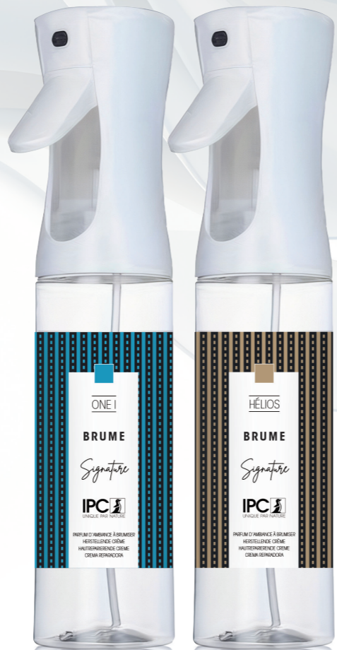
BRUME 270 mL ONE I y Hélios