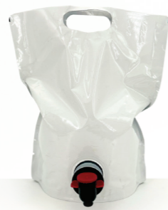
RECHARGE ONE I y Hélios 2,2 L