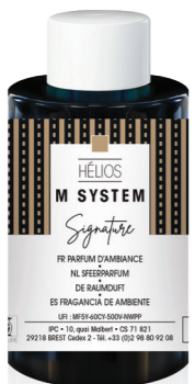
« M » SYSTEM Cartucho 100 mL ONE I y Hélios