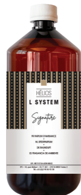
« L » SYSTEM Recarga 1 L* ONE I y Hélios