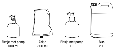
Flesje met pomp 500 ml